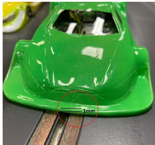
2022 Tesla Model S P100DL Electric GT (2001) Attan