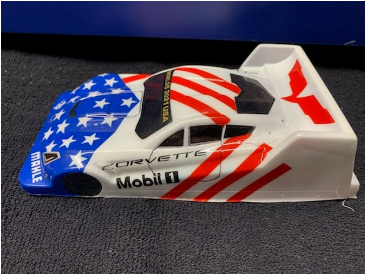
2023 Red Fox C8 Corvette DTM 2019