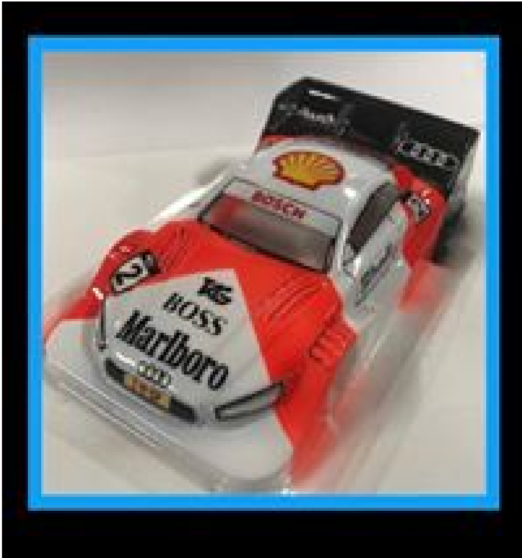
2019 Audi RS5 DTM Redfox